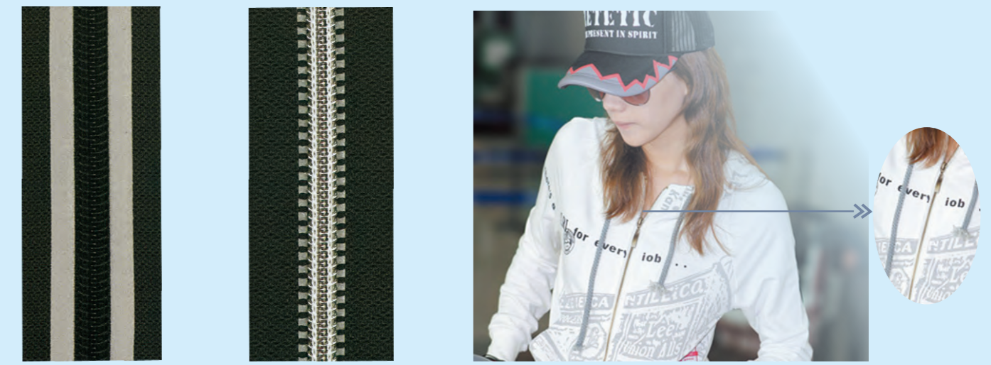
尼龙贴反光条 Nylonglisten tape 尼龙织反光条 Nylon silver teeth with weave glisten tape